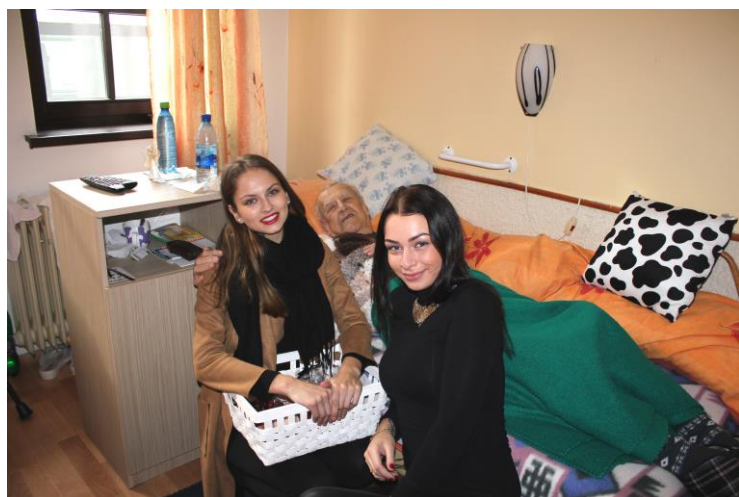
Návšteva v Mestskom centre sociálnych služieb v Modre